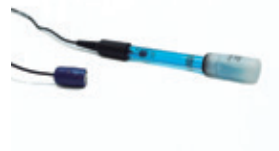
Sonda pH Ho35-SPD01-Mo6