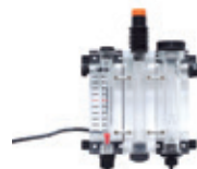
Porta Sondas Probe Holder 9900103052